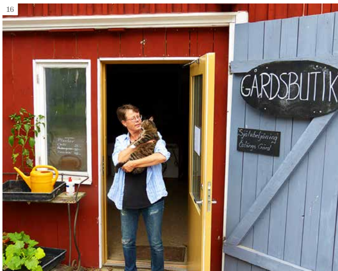
14. Det finns många arbetsmoment i en manuell grönsaksodling. 15. Gårdsbutiken gör skäl för namnet under skördedagar. 16. Katterna är bra på att hålla nere mus- och sorktrycket på gården. Gårdsbutiken är lockande men förbjudet område.

Andra tecken på klimatförändringarna är den myckna förekomsten av sniglar och fästingar – en utveckling vi gärna hade varit utan. Milda vintrar ger mer ohyra, ett enkelt samband.