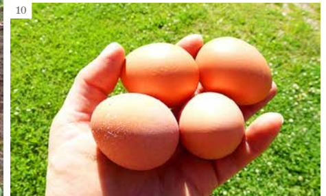
6–10. Fem bilder från överkligheten där solen alltid lysor, hönsen låter sig fångas, det finns grönt i både gris- och hönsdagen samt där äggen alltid är rena. Men så är det emellanåt.