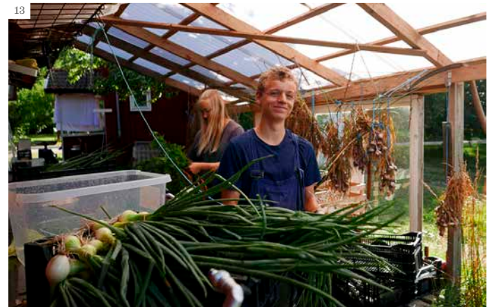
11. Wwoofare brukar uppskatta att få vara med och se hur arbetet i bigården går till. 12. Wwoofarna lämnar fladdermus- eller fågelholkar på Östäng som ett ömsesidigt minne och ett bidrag för biodiversitet. Alla har inte pipskägg. 13. Att skörda och rensa grönsaker är ett ganska hårt men uppskattat arbete.