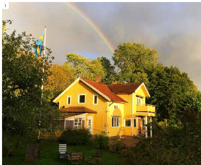
1. Regn, sol och en stega vid fasaden

Så fick vi köpt vår gård till slut. Många års drömmande skulle förverkligas och då är det lätt att starta för många projekt på en gång. Vi har nu gjort sex säsonger på gården. Saker och ting börjar falla på plats, men skulle vi starta om idag så hade vi gjort nästan allting annorlunda.