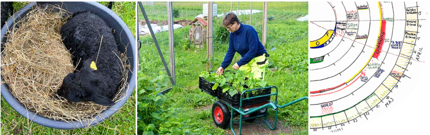
Kvartal 2: Allt sätter fart! Lamning och plantering är två stora göromål.