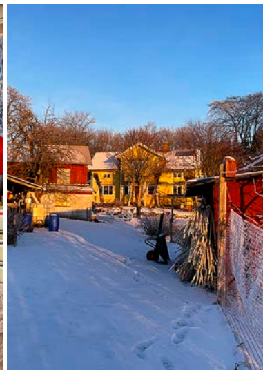
Kvartal 4: mustning, julmarknader och sedan vila.

Första helgen i september är det återigen öppen gård. Nu brukar det vara både Konst-Anten och Mathantverkssafari. Gården är i full aktivitet och mycket blommor och växer. I september är det också fokus på skörd och försäljning av grönsaker för Ylvas del och äppelmottagning och mustning för Jonas. September månad är sista hela månaden med wwoofare. Några hänger kvar en bit in i oktober men oftast är wwoofsäsongen slut i och med september. Vi måste komma ihåg att skicka in ansökan till kommunen för att få stöd till enskild väg.