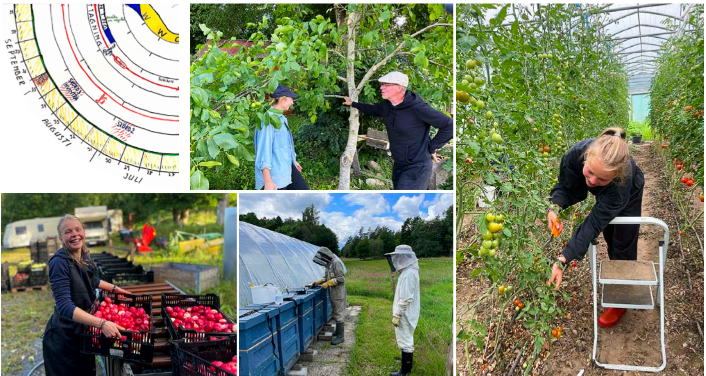
Kvartal 3: skörd och förberedelser inför vintern.